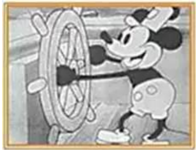
Кадр з мультфільму «Паровозик Віллі»

Мільйони дітей і дорослих усього світу захоплюються мультфільмами Волта Діснея. А розпочався шалений успіх видатної кінокомпанії у далеких 30-х рр. минулого століття з кумедного персонажа — мишенятка Міккі Мауса.