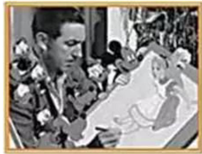
Волт Дісней зі своїми персонажами

Упродовж майже столітньої історії студія Дісней створила багато мультфільмів із чудовою музикою: «Білосніжка і Семеро гномів», «Піноккіо», «Попелюшка», «Спляча красуня» тощо.